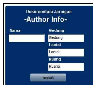
Gambar 1. Form Author

Bagian input author disajikan saat pertama kali program dijalankan. Memunculkan box yang berisi informasi author dan juga lokasi dokumentasi jaringan. Pengguna dapat memasukkan parameter berupa text pada textinput masing-masing bagian. Mulai dari name author , lokasi gedung, lantai, hingga ruangan.