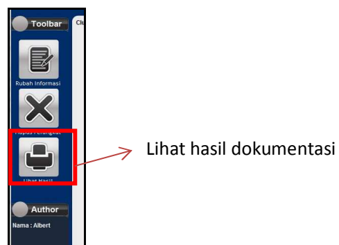
Gambar 4. Icon lihat hasil dokumentasi

Pada proses melihat dokumentasi jaringan, pengguna dapat melihat hasil dokumentasi jaringan dengan cara menggunakan tombol lihat hasil yang terletak pada bagian tool bar program.