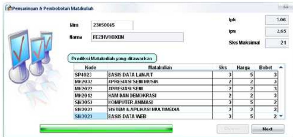
Gambar 1. Penyaringan dan Pembobotan

Hasil matakuliah yang direkomendasikan didapat dengan melakukan proses penyaringan matakuliah yang ditawarkan dengan memperhatikan nilai matakuliah yang diperoleh, syarat prerequisite matakuliah dan syarat total sks matakuliah yang ditawarkan kepada mahasiswa yang akan dianalisis, kemudian dilakukan proses pembobotan dari hasil matakuliah yang sudah disaring tersebut.