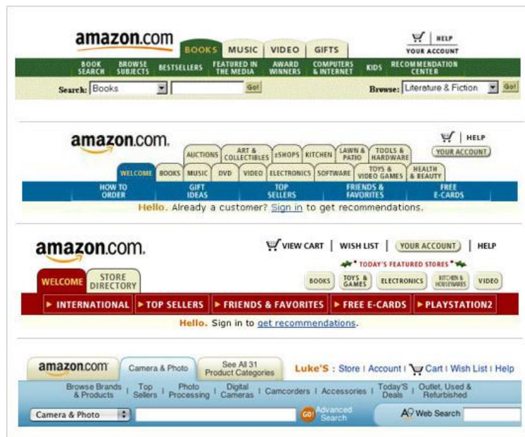
Gambar 5. Tab Amazon.com dari waktu ke waktu (Wroblewski, 2007)

Sementara itu, tabulasi atau tab cocok untuk situs besar. Tab begitu gamblang sehingga sulit untuk terlewatkan, terasa lebih cekatan, dan mampu menandakan ruang fisik. Tab digambar dengan pembeda, diberi kode warna, dan sebaiknya satu tab telah terpilih ketika pengguna masuk untuk membuat pengguna menyadari posisinya (Krug, 2006). Berbagai contoh tab yang dimanfaatkan oleh Amazon dari waktu ke waktu menjadi contoh pada Gambar 5.