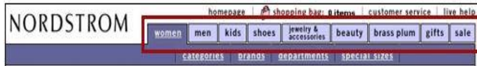
Gambar 2. Global Navigasi (Adkisson, 2005)

Navigasi global adalah rangkaian tautan kategori tingkat tertinggi yang selalu akan muncul pada website seperti pada Gambar 2. Navigasi global membuat header lebih mudah dirancang, tetapi hasilkan langkah tambahan bagi pengguna untuk temukan fungsi utama dari navigasi global. Navigasi global akan membantu pengguna ketika dikombinasikan dengan megamenu untuk menyajikan banyak pilihan sekaligus kepada pengguna. Pilihan pada megamenu dapat berupa citra yang mewakili produk atau istilah yang mewakili pilihan (Cardello & Whinton, 2014). Gambar 3 adalah contoh megamenu.